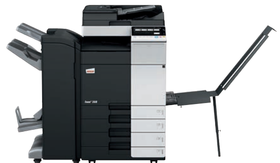
ineo+ 308 con alimentador dual scan (DF-704), finalizador grapador/plegador (FS-534SD), bandeja (BT-C1e) y mesa cassette (PC-210)