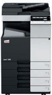
ineo+ 308 con alimentador dual scan (DF-704), bandeja de salida (OT-506) y mesa cassette (PC-210)

Invierta en una ineo+ 308 y se olvidará de depender de empresas externas para trabajos especializados como invitaciones impresas en papel grueso y de alta calidad. Esto le ahorrará tiempo y dinero. La ineo+ 308 admite sobres, papel reciclado, papel preimpreso, transparencias, y muchos otros formatos, incluso tarjetas de hasta 300 g/m 2 . Este sistema puede imprimir una amplia gama de formatos de papel desde A6 hasta SRA3 o formatos especiales definidos por el usuario y banners de hasta 1.2 metros de longitud. Las numerosas opciones de acabado permiten la creación de folletos de hasta 80 páginas, documentos con varios acabados como grapados o perforados. La ineo+ 308 puede realizar casi cualquier tipo de acabado.