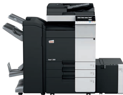
ineo+ 308 con alimentador dual scan (DF-704), finalizador grapador/plegador (FS-534SD), cassette gran capacidad (LU-302) y mesa cassette (PC-410)